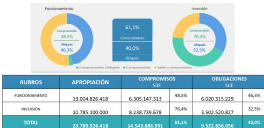
Ilustración 5. Ejecución presupuestal 2022